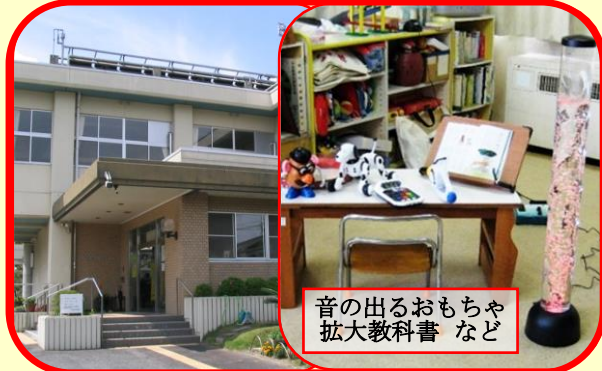
音の出るおもちゃ 拡大教科書 など

岡山県立岡山盲学校 (視覚障害児・者相談支援センター) ☎ 086-272-3165 <平日 9時~17時> 所在地：岡山市中区原尾島4-16-53 e-mail : okamo08@pref.okayama.jp